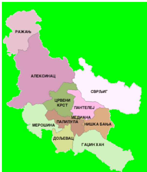
Положај општине Ражањ у Нишавском округу